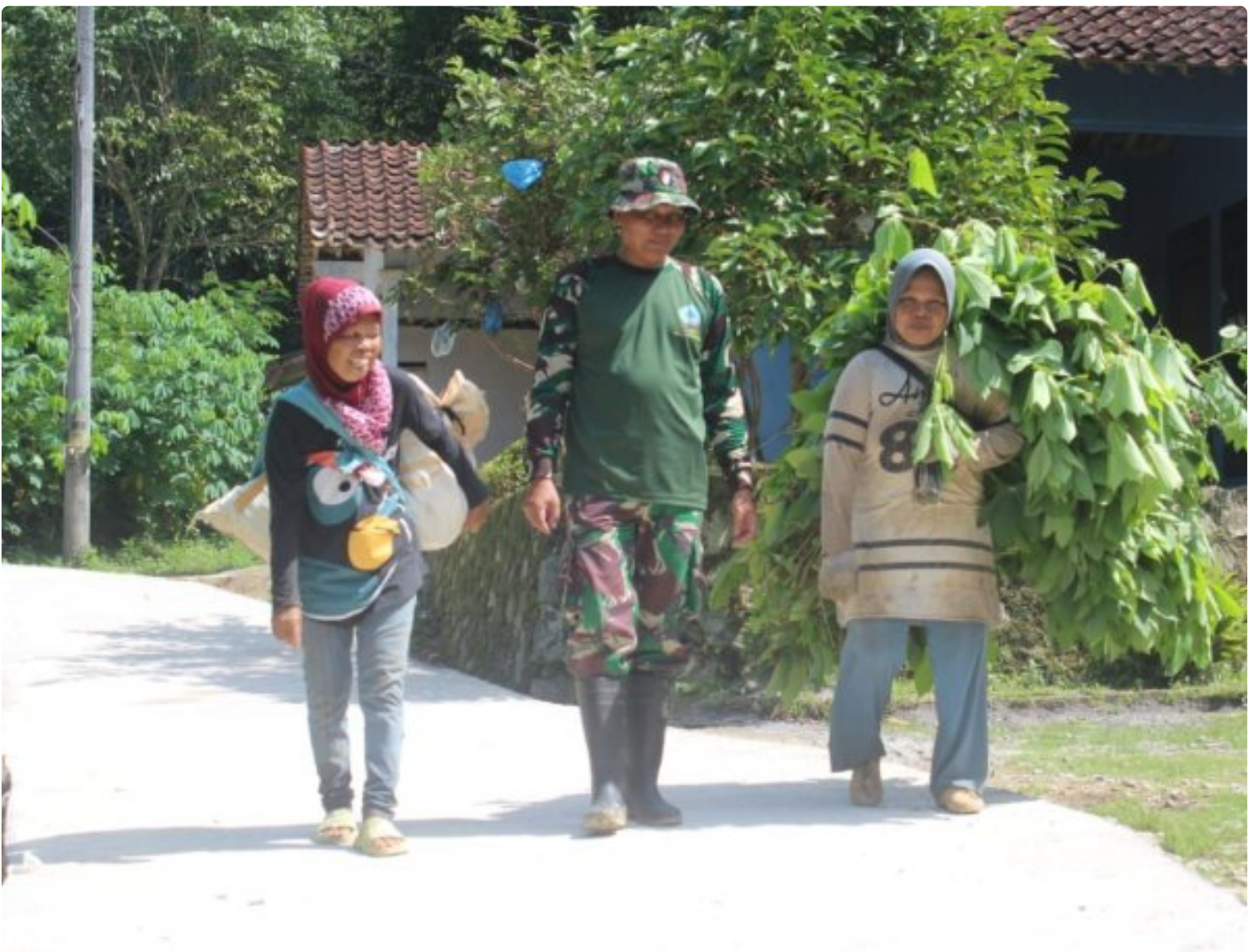
Foto: Anggota Satgas TMMD tak ragu menyisihkan waktu untuk menyapa sekumpulan ibu-ibu yang sedang memanggul rumput di pundak mereka di Desa Somagede, Kecamatan Sempor, Kabupaten Kebumen, Jum'at (20/2/2026).

KEBUMEN - Di tengah hiruk pikuk pembangunan fisik program TMMD Reguler ke-127 Kodim 0709/Kebumen di Desa Somagede, Kecamatan Sempor, Kabupaten