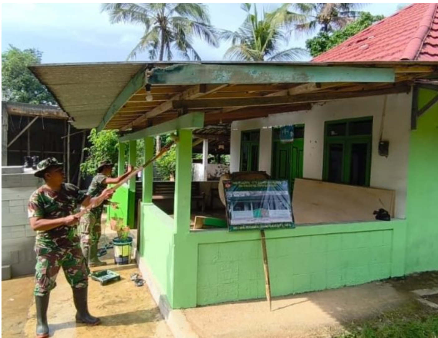
Foto: Anggota Satgas TNI Manunggal Membangun Desa (TMMD) Reguler ke-127 Kodim 0709/Kebumen bersama warga bahu-membahu memperindah Masjid Baitul Tabi'in melalui kegiatan pengecatan, Kamis (19/2/2026).

KEBUMEN - Menjelang bergulirnya bulan suci Ramadhan, semangat kebersamaan dan kepedulian mewarnai Desa Somagede, Kecamatan Sempor, Kabupaten Kebumen. Pada Kamis (19/2/2026), Satgas TNI Manunggal Membangun Desa (TMMD) Reguler ke-127 Kodim 0709/Kebumen bersama warga bahu-membahu memperindah Masjid Baitul Tabi'in melalui kegiatan