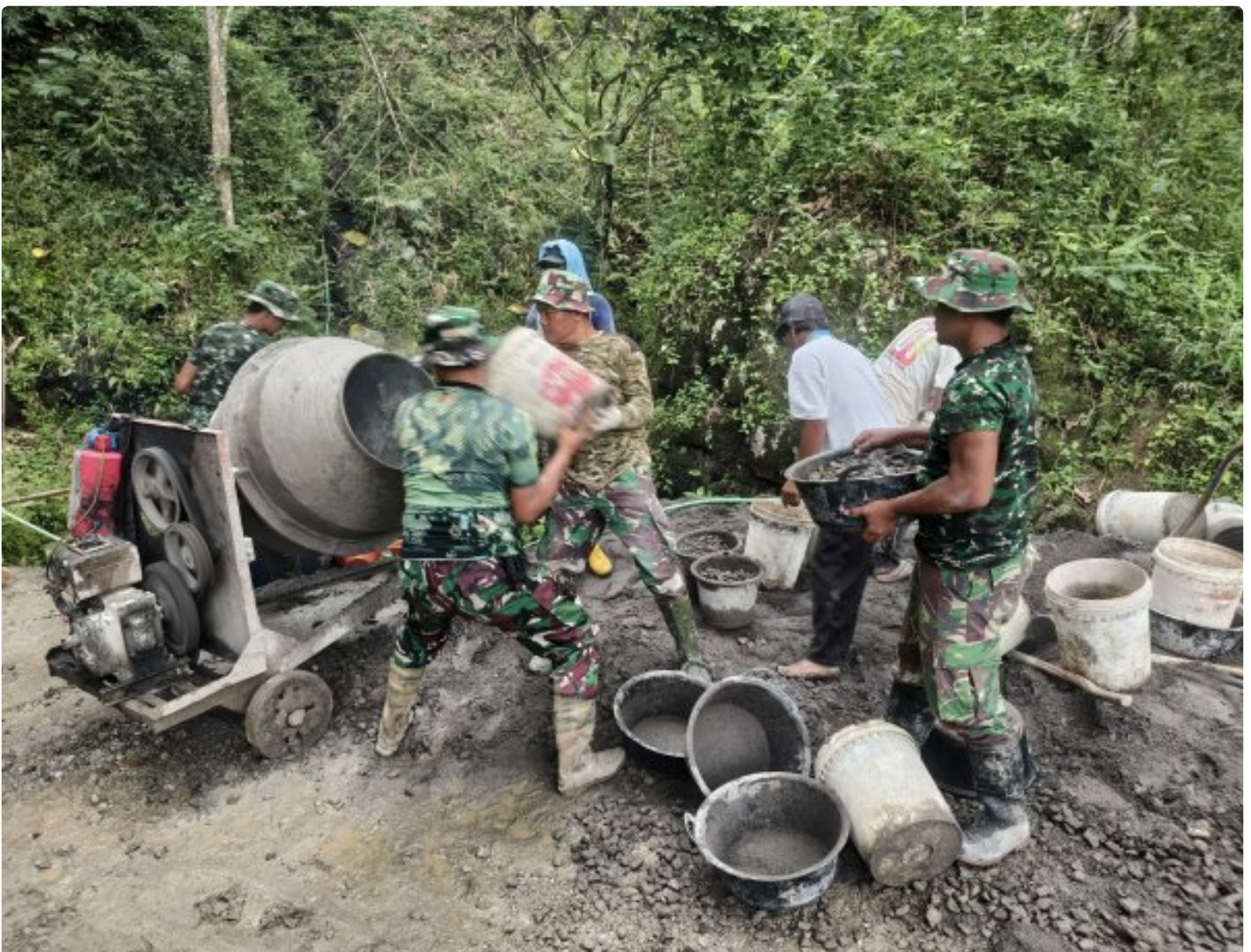
Foto: Anggota Satgas TMMD Reguler ke-127 dari Kodim 0709/Kebumen bersama warga Desa Somagede tak kenal lelah, dengan ketelitian luar biasa, meracik setiap takaran semen, pasir, dan koral dalam pembangunan jalan rabat beton, Kamis (19/2/2026).

KEBUMEN - Di tengah hijaunya perbukitan Desa Somagede, Kecamatan Sempor, Kabupaten Kebumen, pada Kamis (19/2/2026), terukir kisah pengabdian