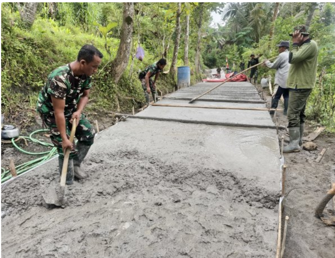
Foto: Pemandangan situasi lokasi meski langit Kebumen menitikkan rintik gerimis, semangat juang Satgas TNI Manunggal Membangun Desa (TMMD) Reguler ke-127 Kodim 0709/Kebumen dan warga Desa Somagede tak sedikit pun surut. Pada Kamis (19/2/2026).

KEBUMEN - Meski langit Kebumen menitikkan rintik gerimis, semangat juang Satgas TNI Manunggal Membangun Desa (TMMD) Reguler ke-127 Kodim 0709/Kebumen dan warga Desa Somagede tak sedikit pun surut. Pada Kamis (19/2/2026), mereka bahu-membahu melanjutkan pekerjaan vital: rabat beton