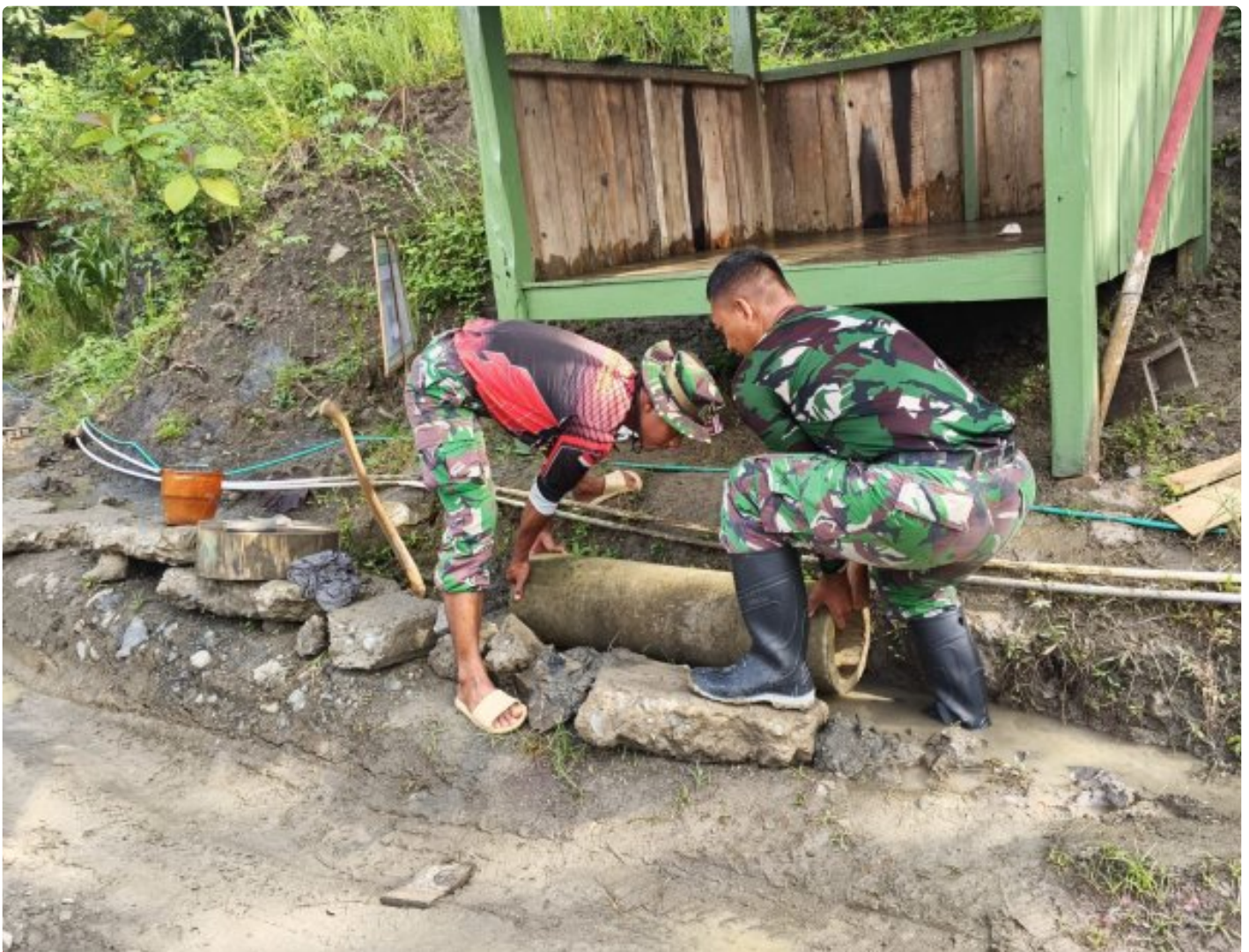
Foto: Personel TNI bersama warga melaksanakan pembangunan gorong-gorong di depan poskamling memastikan aliran air tetap lancar, bertempat Desa Somagede, Kecamatan Sempor, Kabupaten Kebumen, Jawa Tengah. Pada Jumat (20/2/2026).

KEBUMEN - Pembangunan infrastruktur dasar terus digenjot Satgas TMMMD Reguler ke-127 Kodim 0709/Kebumen di Desa Somagede, Kecamatan Sempor,